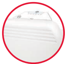
встроенный электронный термостат NCU 1S