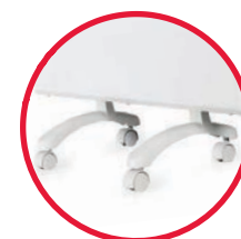
ножки для конвектора (опционально)