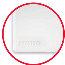
логотип на фронтальной панели